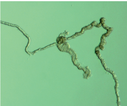
Teil eines Nierenkörperchens und Nierenkanälchens (Maus)